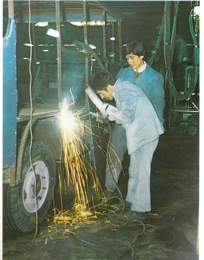
Çelik kafesin sacla kaplanması. Steel frame dressed by steel sheets.