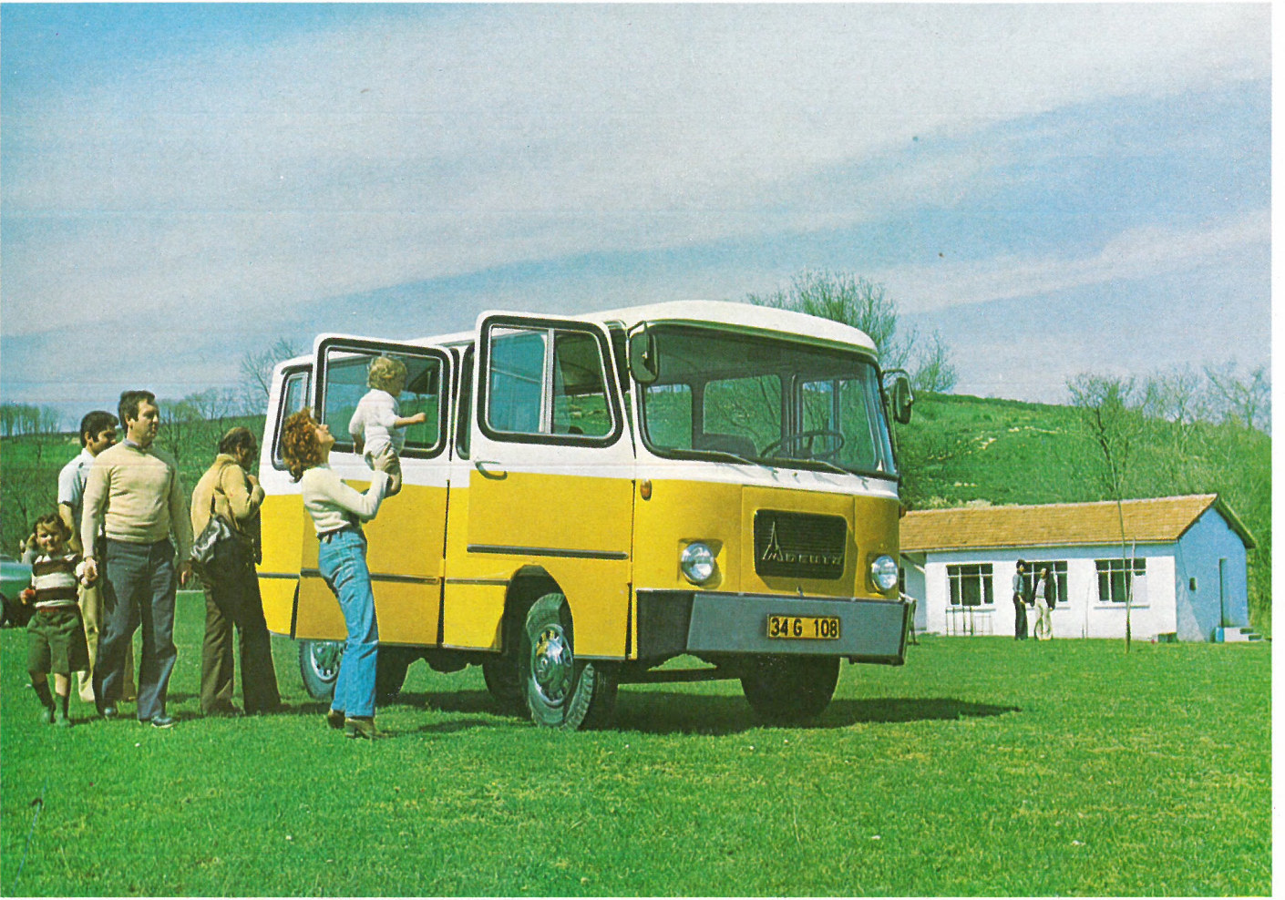
Turizm hizmetinde, her amaç için, her yerde. For long or short journeys of groups.