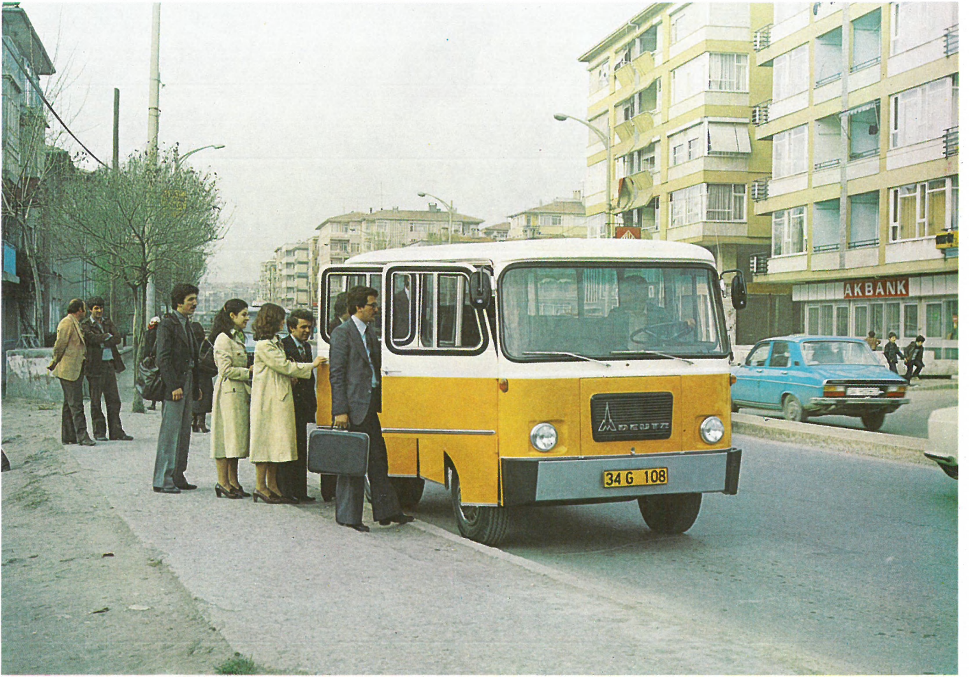
Şehirçi ulaşımında büyük hizmet. In urban transportation service.