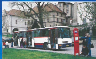
B 952/B 951/B 961