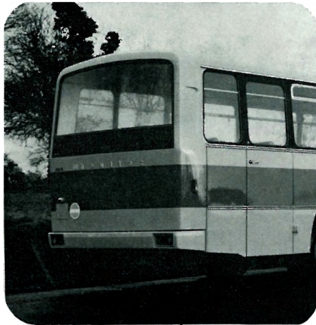
Nouvelle face arrière panoramique.