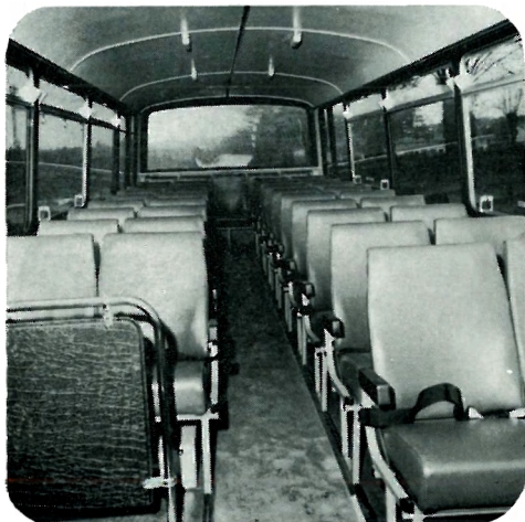
Intérieur confortable et soigné.